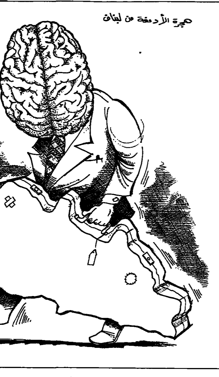
حجرة الأدمغة من لبنان

وقدمت الكويت مساعدة عينية بقيمة ٥ مليون دولار وزعت على الفئات المحتاجة. وبين عامي ١٩٨٩ و ١٩٩٠ قدمت حكومة الكويت مستشفى النجدة الشعبية في مدينة المحطات الكهروكهربائية (جنوب لبنان) وتضم ٧٥ سريرا بمعدات وتجهيزات طبية حديثة تم ارسالها بحمولة ١٢٠ وحدة غذائية الى لبنان ٤٠٠ وحدة طبية و ٨٠ مواد غذائية لتوزع على طلبة المدارس والمناطق بواسطة الهيئة العليا للاغاثة.